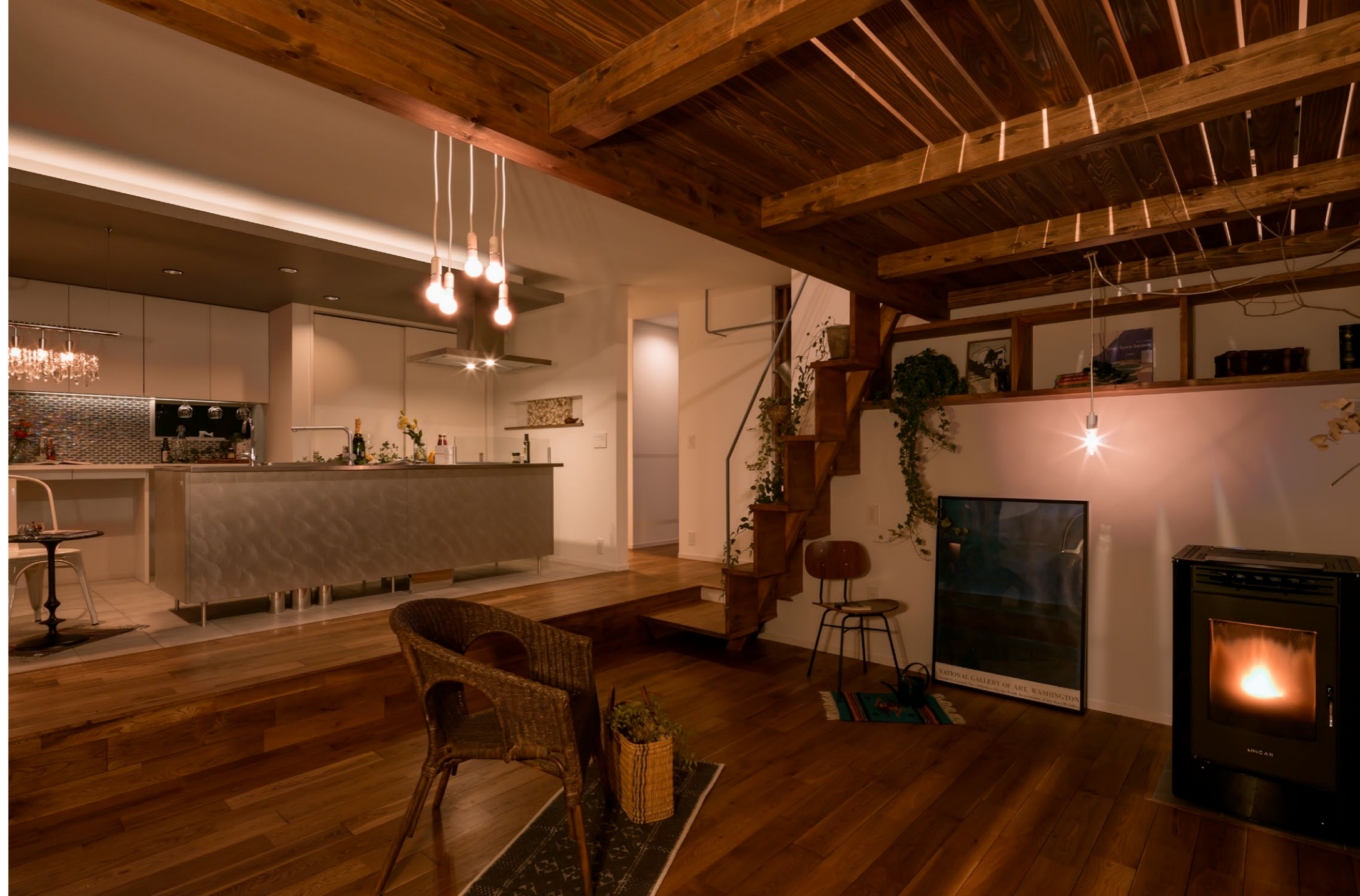
リビング上部にロフト。層構造の個性的な空間をペレットストーブの炎が優しく照らし出す