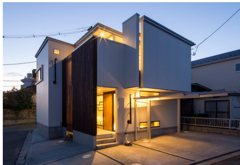
上：玄関では坪庭の緑が出迎える。樹が高く成長すれば2階からも望めるよう吹き抜けとした 下：限られた敷地を最大限活用しつつ、プライバシーにも配慮した住まい