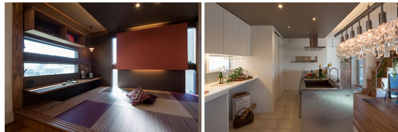
2階和室の朱色壁は、子どもたちも一緒に塗り上げた家づくりの思い出。 カウンターは足を下ろせるつくりになっている

TEL 022-739-9925 宮城県仙台市青葉区水の森3-20-1 https://studiomadoi.co.jp E-mail: info@studiomadoi.co.jp