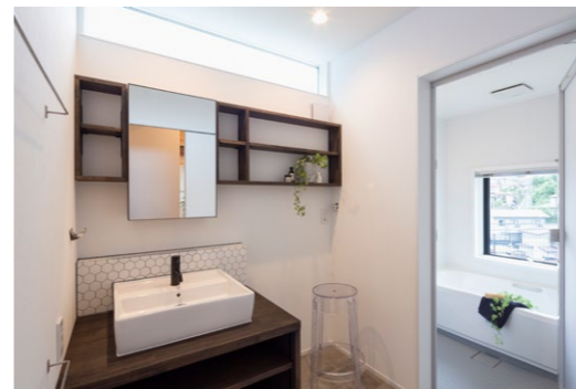
右：掃除機や日用品、リビングまわりのモノはここへ。収納は複数箇所ではなく一極集中型

TEL 022-739-9925 宮城県仙台市青葉区水の森3-20-1 https://studiomadoi.co.jp E-mail: info@studiomadoi.co.jp