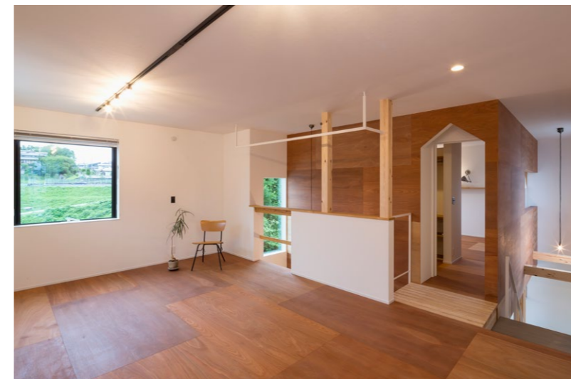
2階の子ども部屋は、壁や床にラワンベニヤを用いた個性的な仕上げ