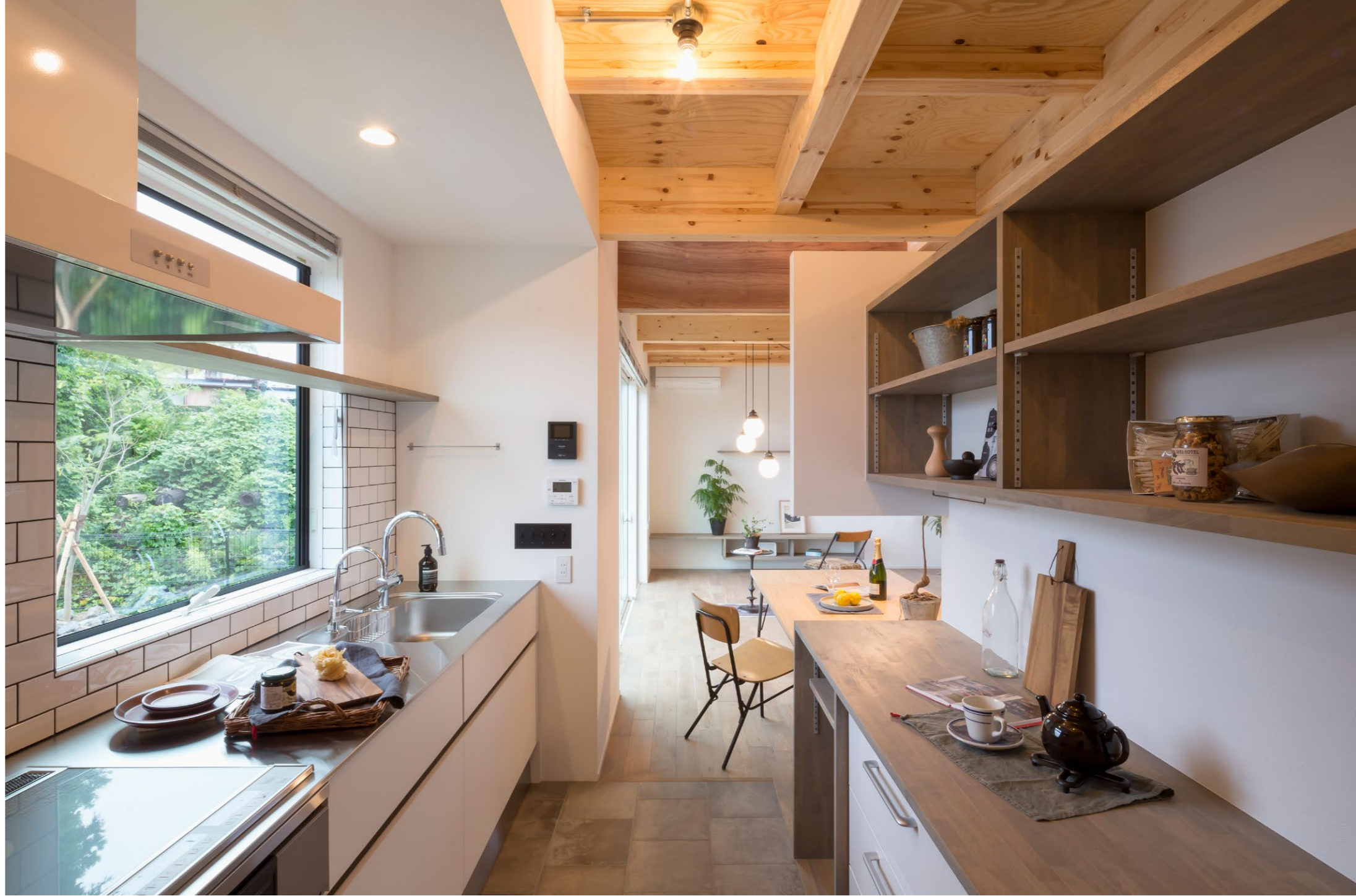
窓からの眺めを楽しみながら料理できるキッチン。ダイニングとの動線もスムーズ。ダイニング上部は吹き抜けになっている