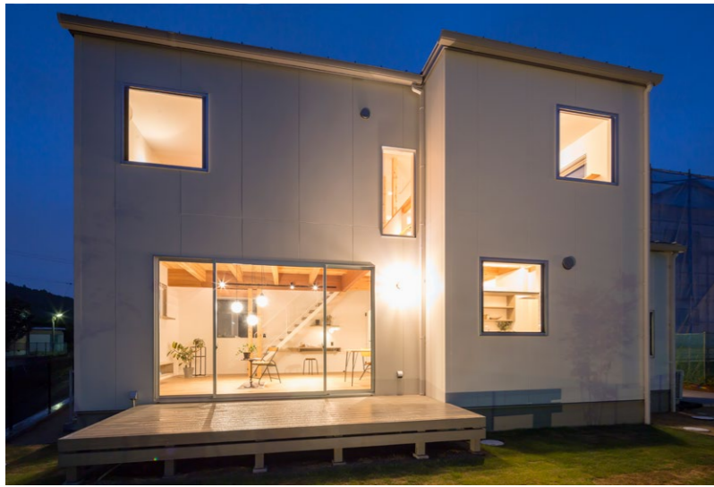
上：南面ファサード。隣地住宅との距離が近いので、採光確保とプライバシーへの配慮を両立 下：閉じた印象の南面とは異なる表情を見せる、眺望第一でプランニングしたYさん宅の北面外観。夕景に浮かぶシルエットも美しい